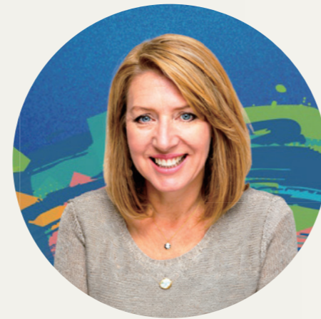
Liz Wiseman 리즈 와이즈먼